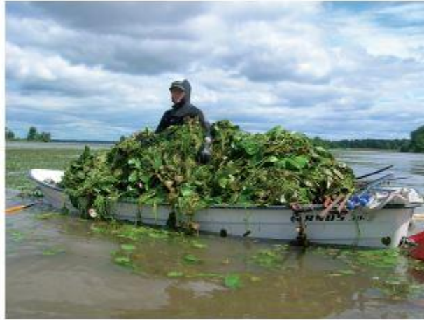
Försök med bekämpning av Sjögull i Galten i Kungsörs kommun.